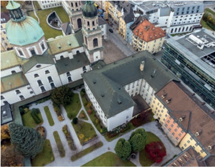
Vista aérea del campus jesuita de Innsbruck

El Departamento de Filosofía en la Facultad de Teología de la Universidad de Innsbruck está lanzando un nuevo programa de magíster en filosofía: Filosofía de la Religión. Este comenzará en octubre de 2022.