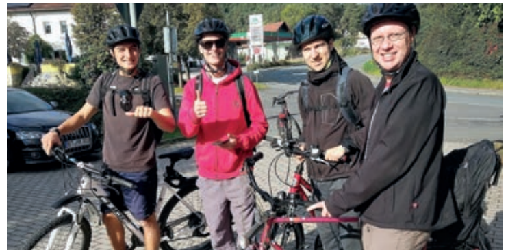
Los novicios junto a su maestro de novicios.

a su maestro y al socio debieran trasladarse a su nueva casa. Es importante tener espacios propios y separados para los novicios. Al mismo tiempo, ellos serán parte de un grupo más grande de jesuitas viviendo y trabajando en el campus del Jesuitenkolleg.